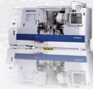
DOOSAN PUMA 400L